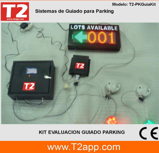
KIT EVALUACION GUIADO PARKING